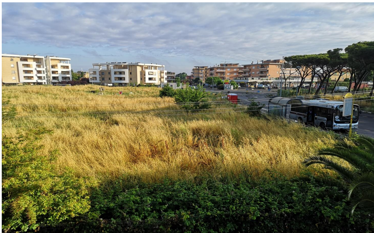
Verso Via dei Monti di San Paolo, capolinea dello 08 e Pinetina Monti di San Paolo con Casale Raggio di Sole

La situazione attuale rappresenta un potenziale pericolo in caso di un innesco d'incendio. Seguono foto dei luoghi scattate in data 23 Maggio e 7 giugno c.a..