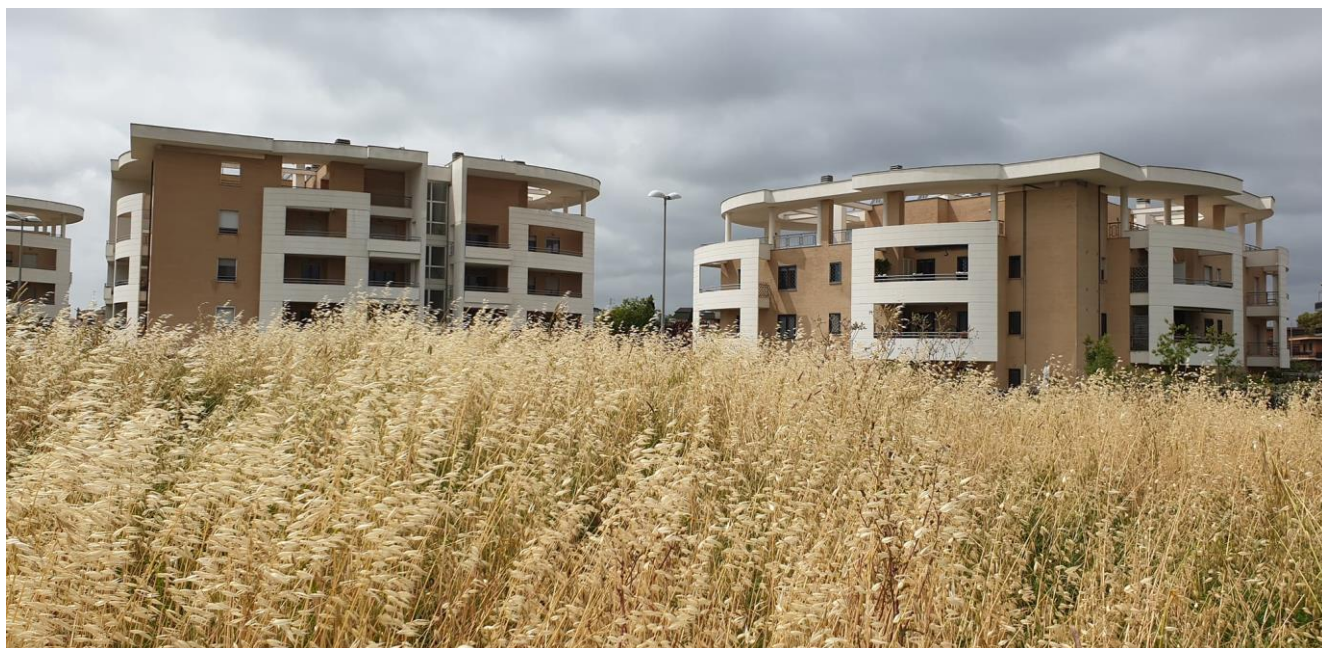
Verso Via Daniele Badiali