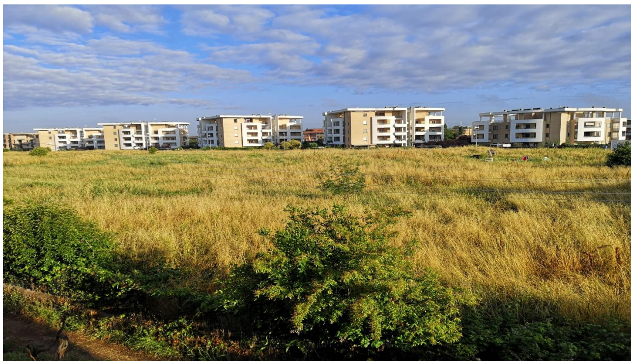
Verso Via Daniele Badiali