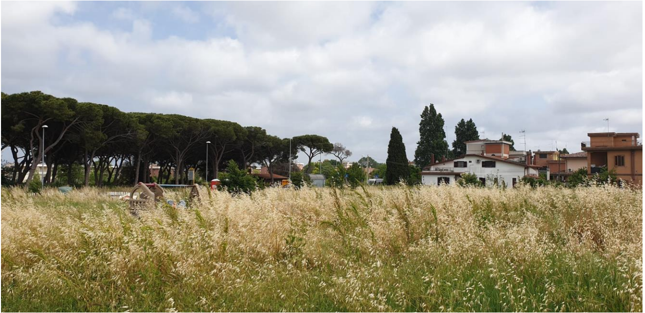
Verso Pinetina dei Monti di San Paolo, capolinea 08 ed abitazioni cui si accede da Via Guido Maria Conforti

Per quanto sopra, si chiede alle SS.VV., ciascuno per le proprie competenze, di voler intraprendere le opportune azioni affinché siano ripristinate le necessarie condizioni di sicurezza.