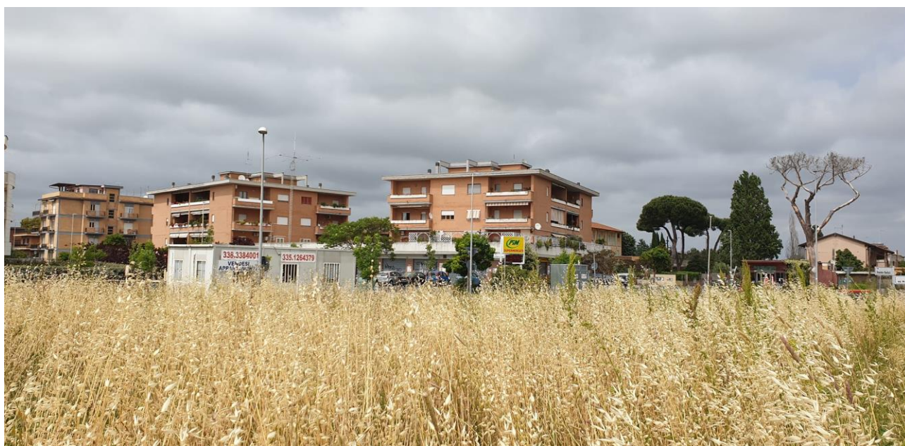
Verso rotatoria di Via dei Monti di San Paolo altezza Supermercato PIM